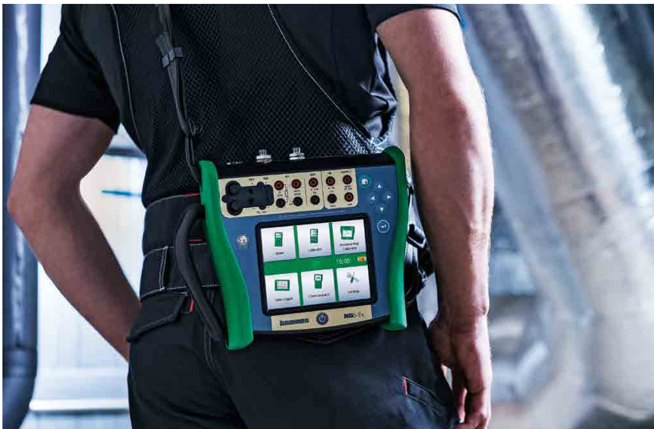
现场设备 | Beamex MC6-Ex