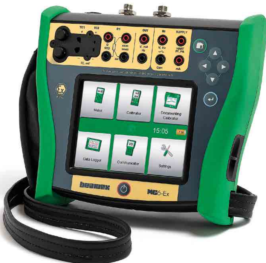
Beamex MC6-Ex | 现场设备